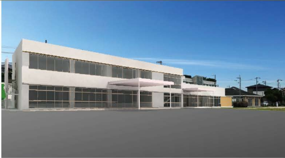
市民センター 完成図