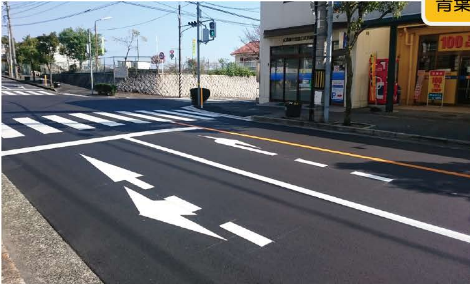
青葉台ピュアック前の交差点

交通事故が頻発していた青葉台交差点の改良を市に要望し昨年 11 月に 2 車線化を実現しました。